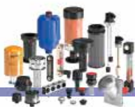
ACCESSOIRES POUR RESERVOIR

Les secteurs auxquels les produits MP Filtri sont destinés vont des machines industrielles aux machines d'exploitation mobiles, tels que les engins de terrassement, les éoliennes ou encore les machines pour l'industrie du plastique, fabriqués par les constructeurs les plus prestigieux.