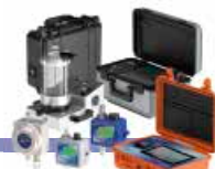
SOLUTIONS D'ANALYSE DES FLUIDES