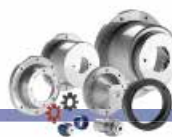
PRODUITS DE TRANSMISSION DE PUISSANCE